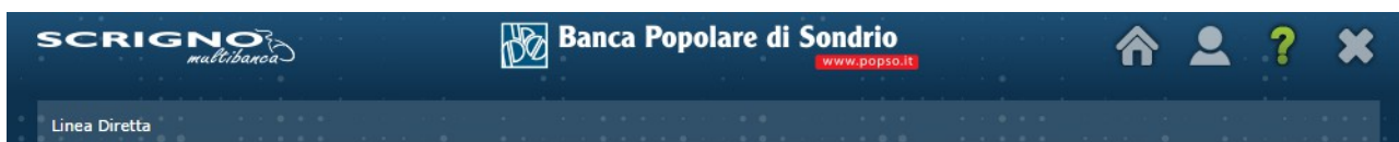
Figura 5: Menu di II Livello - Help

Al terzo livello troviamo le macrofunzionalità dell'applicazione raggruppate in sottogruppi titolati.