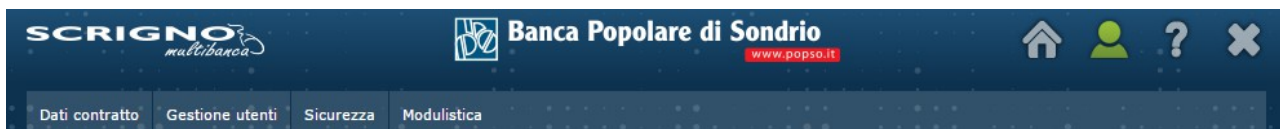
Figura 4: Menu di II Livello - Profilo