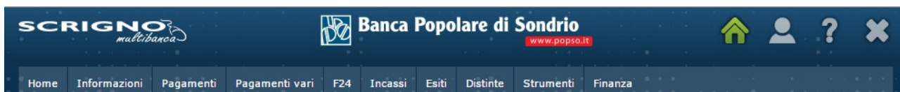
Figura 3: Menu di II Livello - Banca