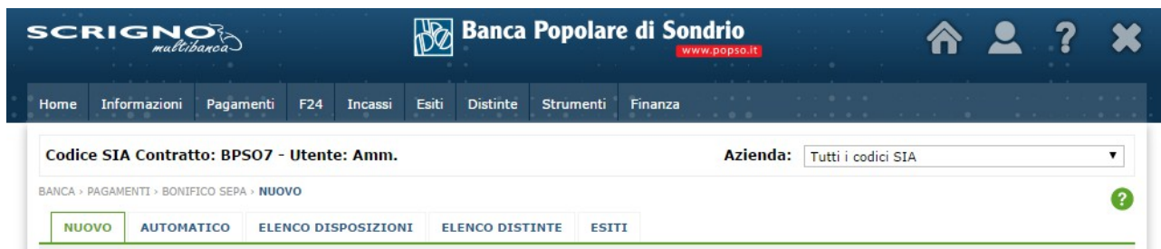
Figura 7: Pagamenti - Macrofunzionalità

Nel nuovo servizio Scigno Multibanca l'inserimento di una disposizione di pagamento comporta di default la creazione di una distinta e la richiesta di compilazione delle informazioni relative alla distinta (cfr. Figura 8). Qualora l'utente desideri creare una disposizione singola deve selezionare nel campo "Crea distinta" il valore "Dopo".